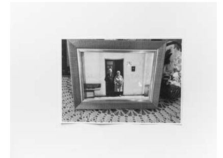
#13 y #14, 2019 Fotografía digital b/n. Impresión 12 tintas pigmentadas Lucia Ex sobre Papel Hahnemühle Photo Rag@Baryta 315 g/m 2 100% Algodón Blanco Extrabrillante 20x30cm | 1/20 [Documentación]