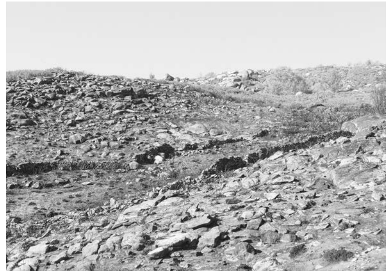
#6, 2017 Fotografía digital b/n. Impresión 12 tintas pigmentadas Lucia Ex sobre Papel Hahnemühle Photo Rag®Baryta 315 g/m 2 100% Algodón Blanco Extrabrillante 26,5x40 cm | 1/5