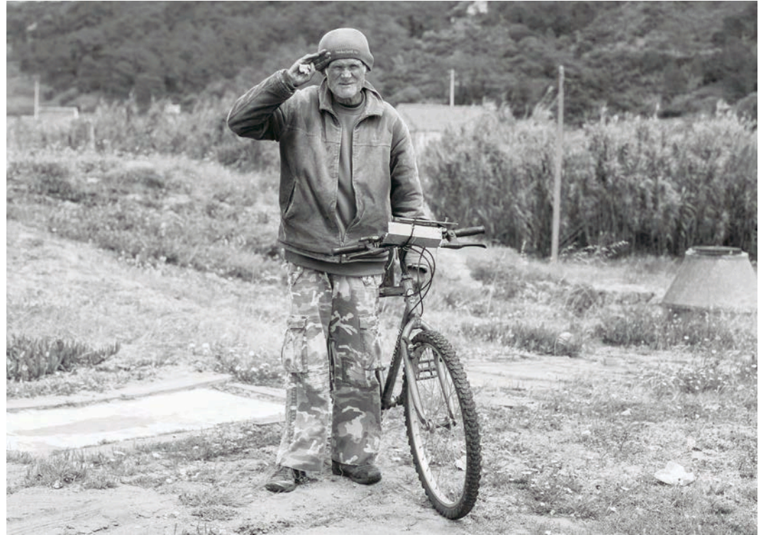
#24, 2018 Fotografía digital b/n. Impresión 12 tintas pigmentadas Lucia Ex sobre Papel Hahnemühle Photo Rag@Baryta 315 g/m 2 100% Algodón Blanco Extrabrillante 66,7x100 cm | 1/5