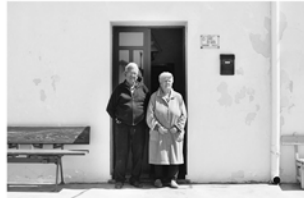
#10, #11 y #12, 2018 Fotografía digital b/n. Impresión 12 tintas pigmentadas Lucia Ex sobre Papel Hahnemühle Photo Rag@Baryta 315 g/m 2 100% Algodón Blanco Extrabrillante 1/5