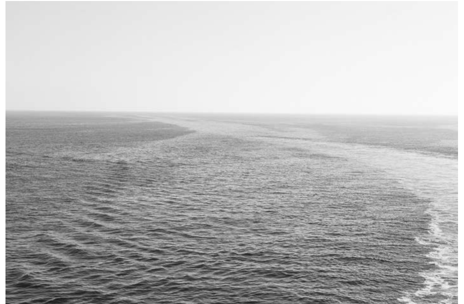
#1, 2018 Fotografía digital b/n. Impresión 12 tintas pigmentadas Lucia Ex sobre Papel Hahnemühle Photo Rag®Baryta 315 g/m 2 100% Algodón Blanco Extrabrillante 46x70 cm | 1/20