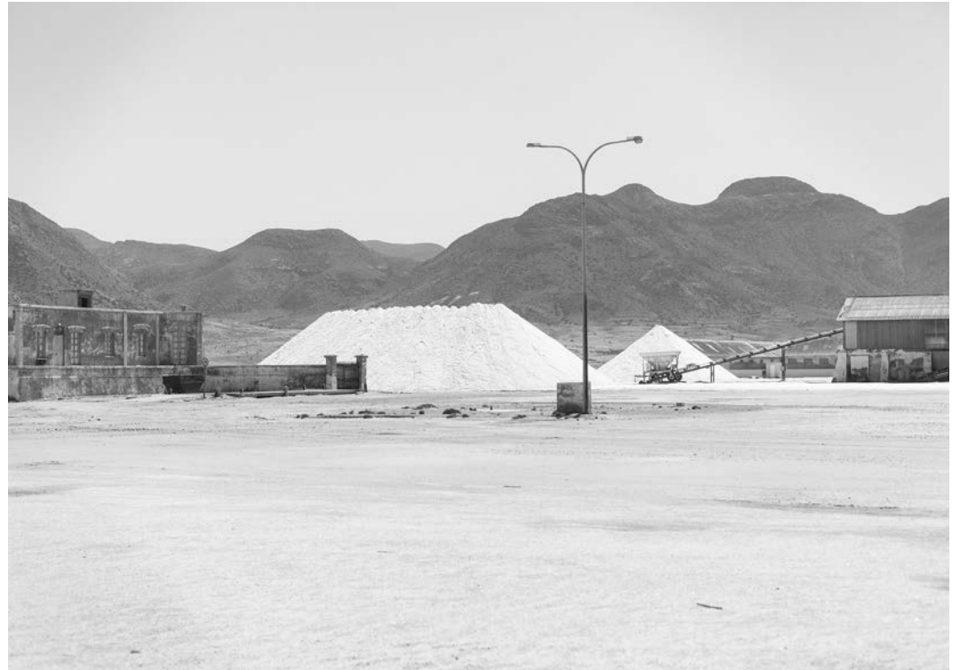
#10, 2018 Fotografía digital b/n. Impresión 12 tintas pigmentadas Lucia Ex sobre Papel Hahnemühle Photo Rag@Baryta 315 g/m 2 100% Algodón Blanco Extrabrillante 66,7x100 cm | 1/5