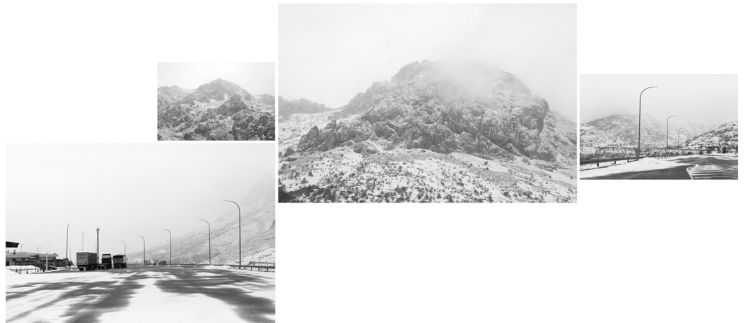
#15, #16, #17 y #18, 2017 Fotografía digital b/n. Impresión 12 tintas pigmentadas Lucia Ex sobre Papel Hahnemühle Photo Rag@Baryta 315 g/m 2 100% Algodón Blanco Extrabrillante 1/5