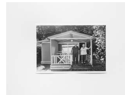
#26, #27, #28, #29 y #30, 2019 Fotografía digital b/n. Impresión 12 tintas pigmentadas Lucia Ex sobre Papel Hahnemühle Photo Rag@Baryta 315 g/m 2 100% Algodón Blanco Extrabrillante 20x30cm | 1/20 [Documentación]