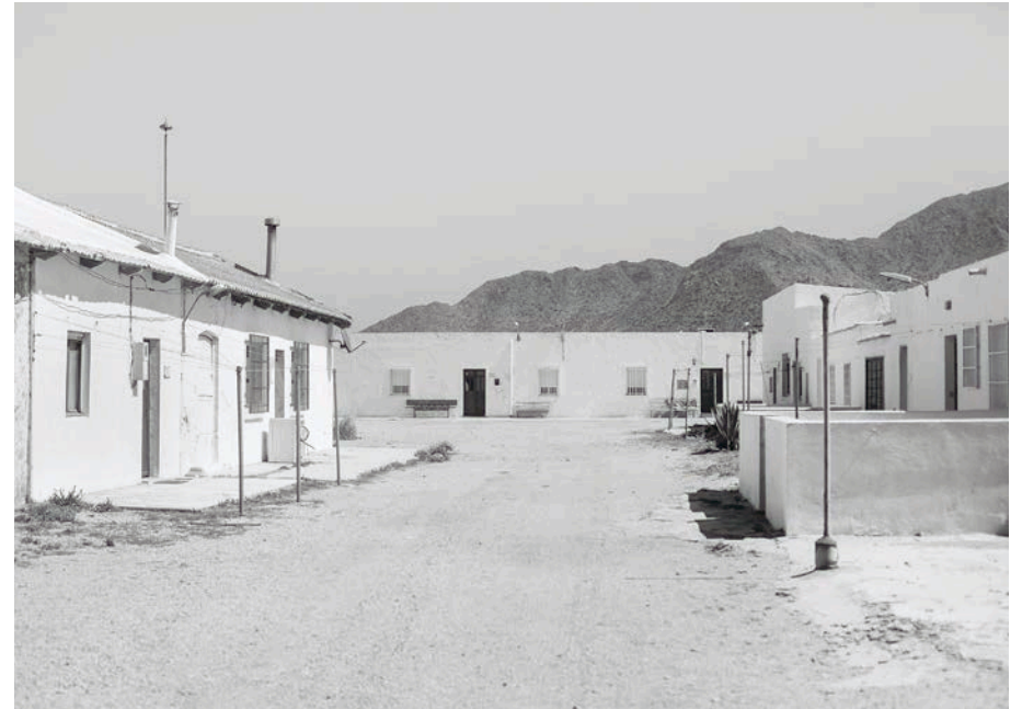
#11, 2018 Fotografía digital b/n. Impresión 12 tintas pigmentadas Lucia Ex sobre Papel Hahnemühle Photo Rag@Baryta 315 g/m 2 100% Algodón Blanco Extrabrillante 40x60 cm | 1/5