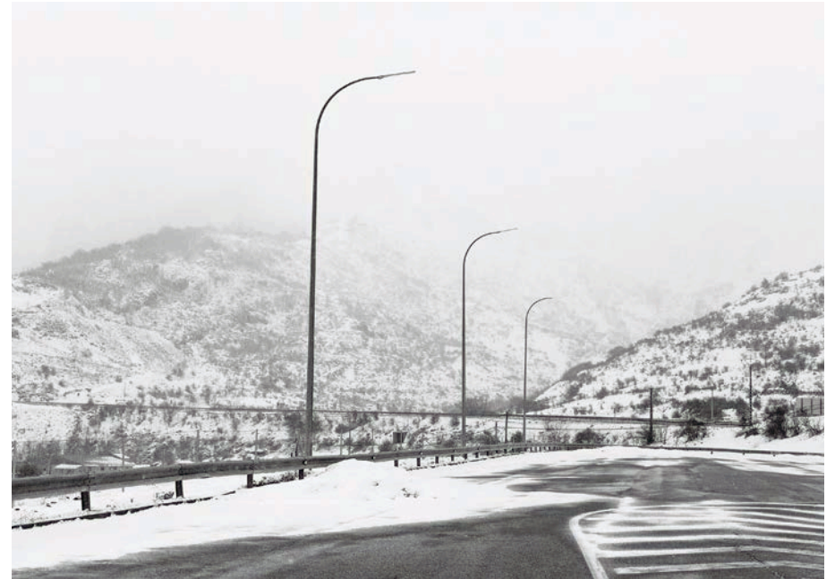
#17, 2017 Fotografía digital b/n. Impresión 12 tintas pigmentadas Lucia Ex sobre Papel Hahnemühle Photo Rag@Baryta 315 g/m 2 100% Algodón Blanco Extrabrillante 40x60 cm | 1/5