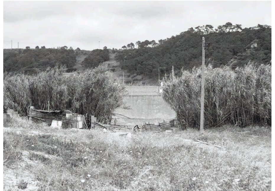
#25, 2018 Fotografía digital b/n. Impresión 12 tintas pigmentadas Lucia Ex sobre Papel Hahnemühle Photo Rag®- Baryta 315 g/m 2 100% Algodón Blanco Extrabrillante 43x65 cm | 1/5