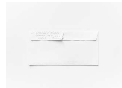
#7, #8 y #9, 2019 Fotografía digital b/n. Impresión 12 tintas pigmentadas Lucia Ex sobre Papel Hahnemühle Photo Rag@Baryta 315 g/m 2 100% Algodón Blanco Extrabrillante 20x30cm | 1/20 [Documentación]