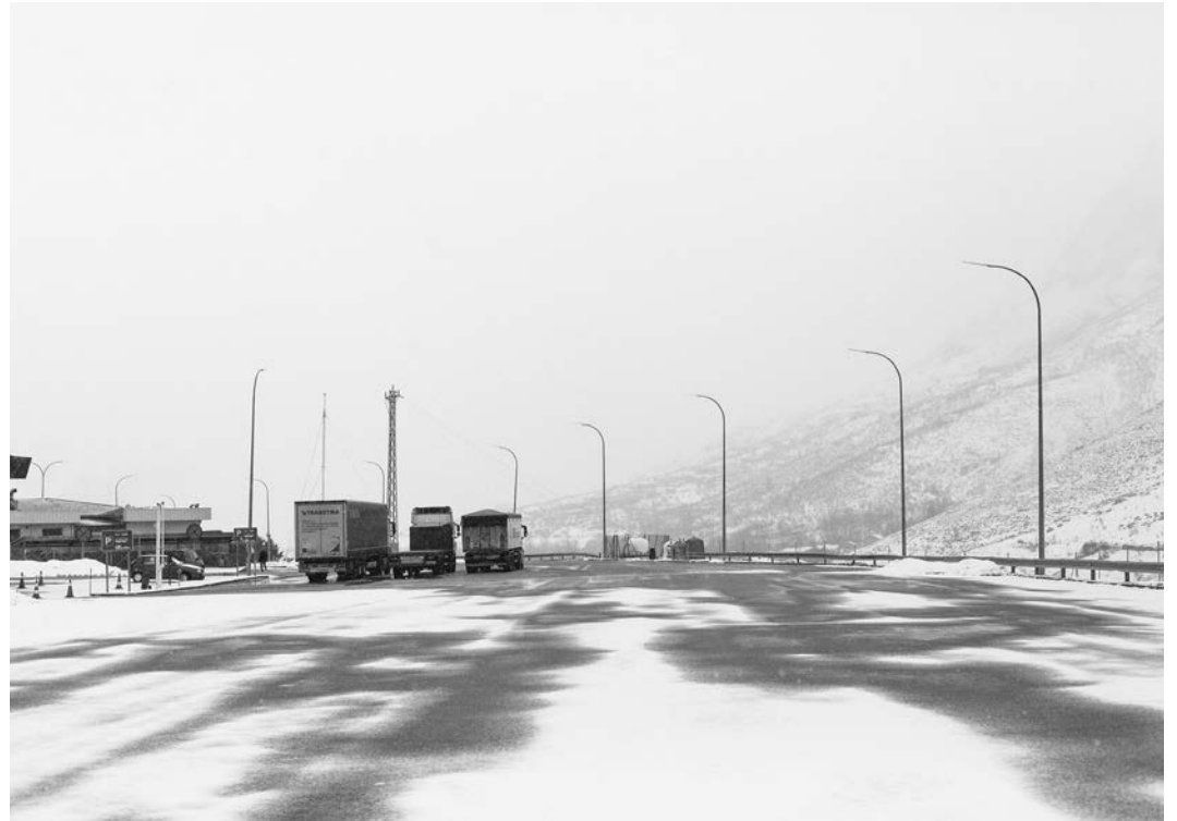
#16, 2017 Fotografía digital b/n. Impresión 12 tintas pigmentadas Lucia Ex sobre Papel Hahnemühle Photo Rag®Baryta 315 g/m 2 100% Algodón Blanco Extrabrillante 66,7x100 cm | 1/5