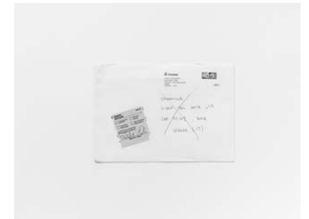
#2 y #3, 2019 Fotografía digital b/n. Impresión 12 tintas pigmentadas Lucia Ex sobre Papel Hahnemühle Photo Rag@Baryta 315 g/m 2 100% Algodón Blanco Extrabrillante 20x30cm | 1/20 [Documentación]