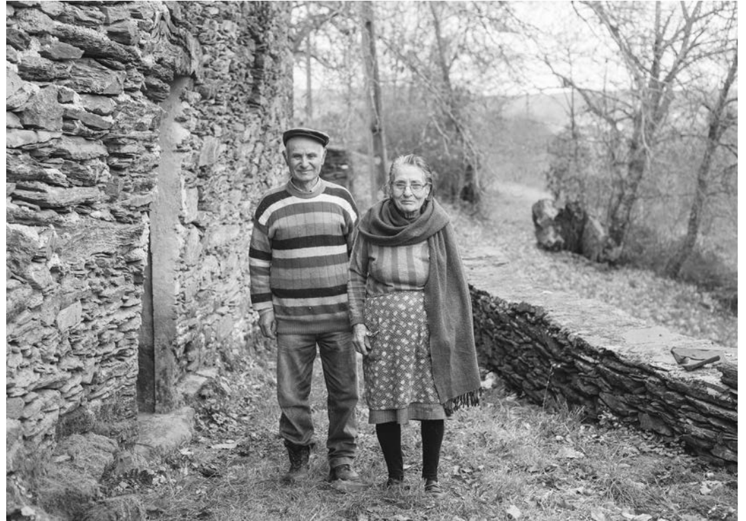
#4, 2017 Fotografía digital b/n. Impresión 12 tintas pigmentadas Lucia Ex sobre Papel Hahnemühle Photo Rag@Baryta 315 g/m 2 100% Algodón Blanco Extrabrillante 66,7x100 cm | 1/5