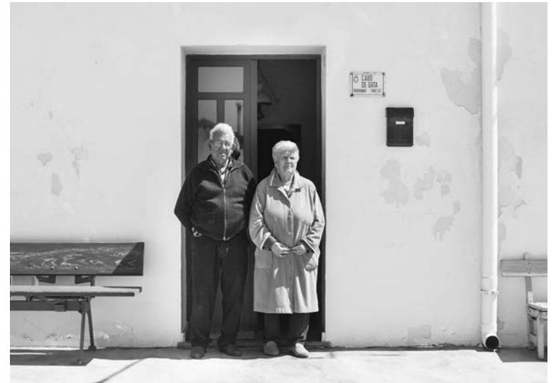
#12, 2018 Fotografía digital b/n. Impresión 12 tintas pigmentadas Lucia Ex sobre Papel Hahnemühle Photo Rag@Baryta 315 g/m 2 100% Algodón Blanco Extrabrillante 26,5x40 cm | 1/5