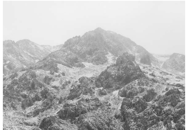
#18, 2017 Fotografía digital b/n. Impresión 12 tintas pigmentadas Lucia Ex sobre Papel Hahnemühle Photo Rag@Baryta 315 g/m 2 100% Algodón Blanco Extrabrillante 26,5x40 cm | 1/5