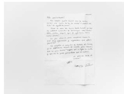
#20, #21, #22 y #23, 2019 Fotografía digital b/n. Impresión 12 tintas pigmentadas Lucia Ex sobre Papel Hahnemühle Photo Rag@Baryta 315 g/m 2 100% Algodón Blanco Extrabrillante 20x30cm | 1/20 [Documentación]