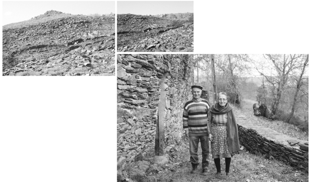
#4, #5 y #6, 2017 Fotografía digital b/n. Impresión 12 tintas pigmentadas Lucia Ex sobre Papel Hahnemühle Photo Rag@Baryta 315 g/m 2 100% Algodón Blanco Extrabrillante 1/5