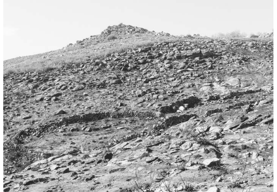
#5, 2017 Fotografía digital b/n. Impresión 12 tintas pigmentadas Lucia Ex sobre Papel Hahnemühle Photo Rag@Baryta 315 g/m 2 100% Algodón Blanco Extrabrillante 40x60 cm | 1/5