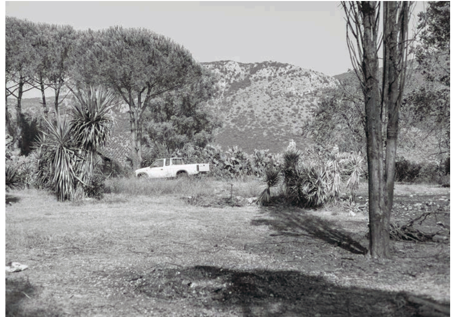
#19, 2018 Fotografía digital b/n. Impresión 12 tintas pigmentadas Lucia Ex sobre Papel Hahnemühle Photo Rag@Baryta 315 g/m 2 100% Algodón Blanco Extrabrillante 43x65 cm | 1/5