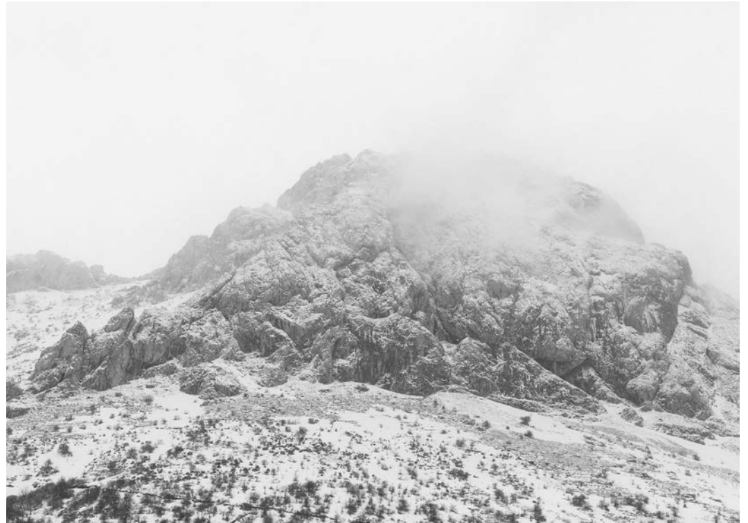
#15, 2017 Fotografía digital b/n. Impresión 12 tintas pigmentadas Lucia Ex sobre Papel Hahnemühle Photo Rag@Baryta 315 g/m 2 100% Algodón Blanco Extrabrillante 66,7x100 cm | 1/5