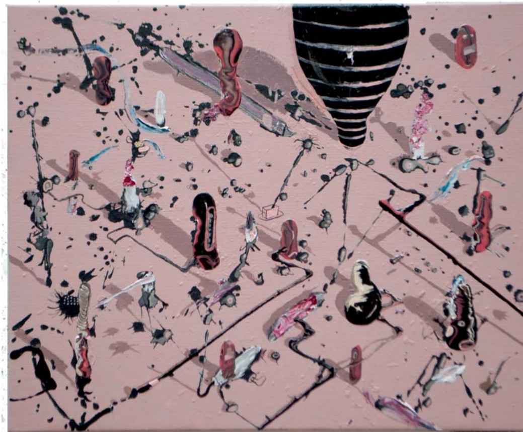
Jose Castiella | The martian chronicles, 2016 Acrílico y óleo sobre lino | 50 x 61 cm