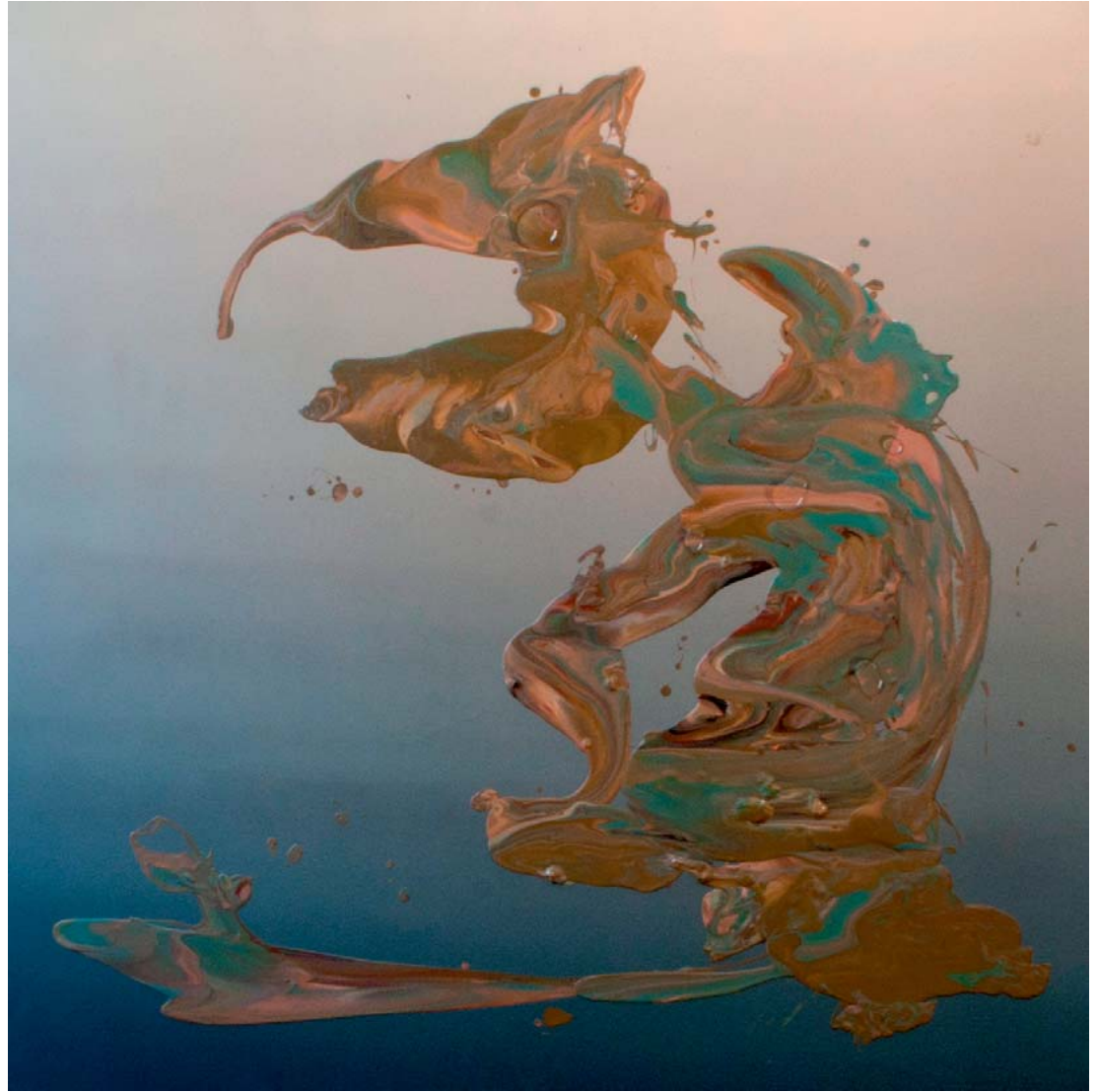
Jose Castiella | Wilderness, 2016 Acrílico y óleo sobre lino | 195 x 195 cm