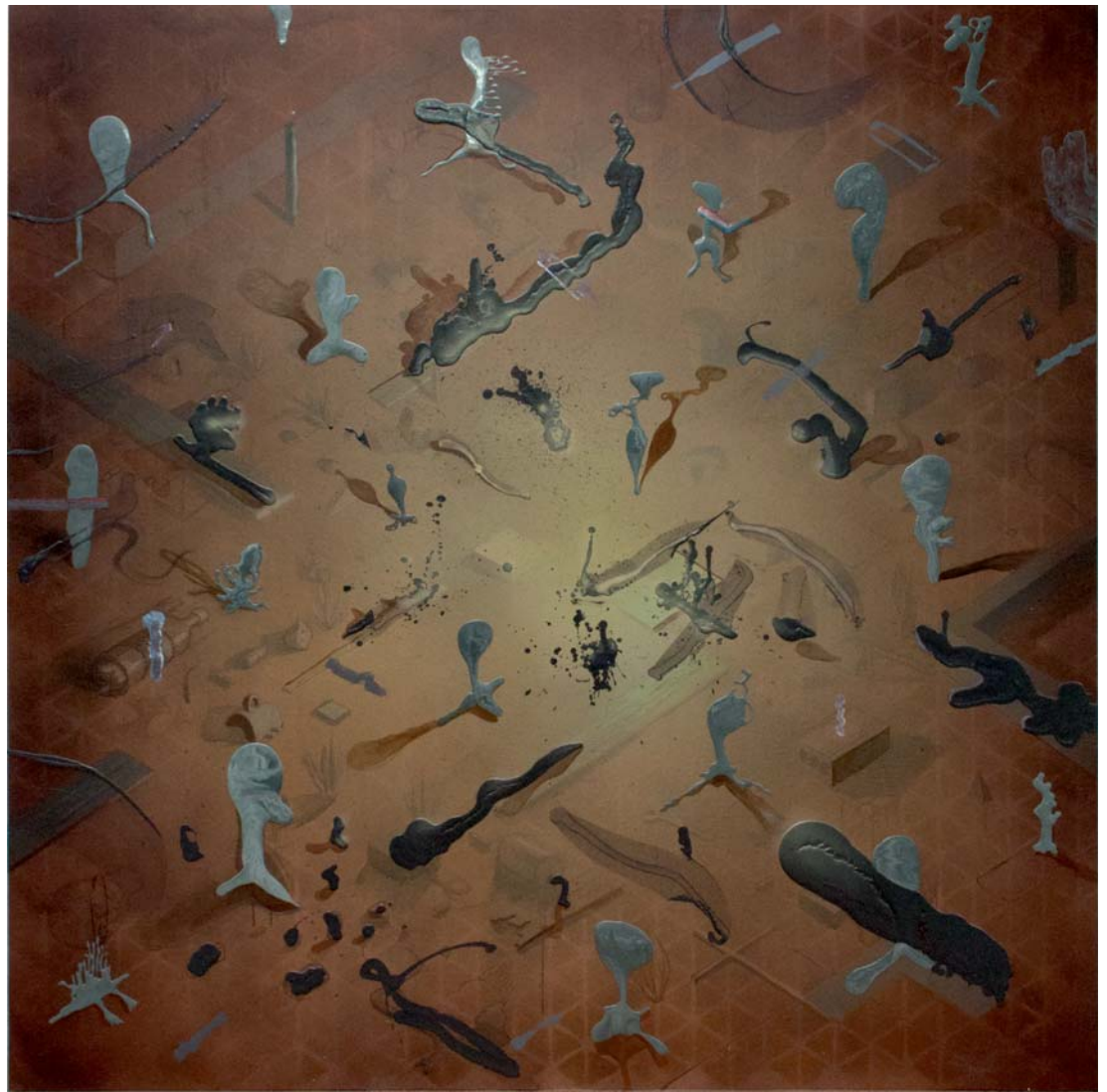
Jose Castiella | There will come soft rains, 2016 Acrílico y óleo sobre lino | 195 x 195 cm