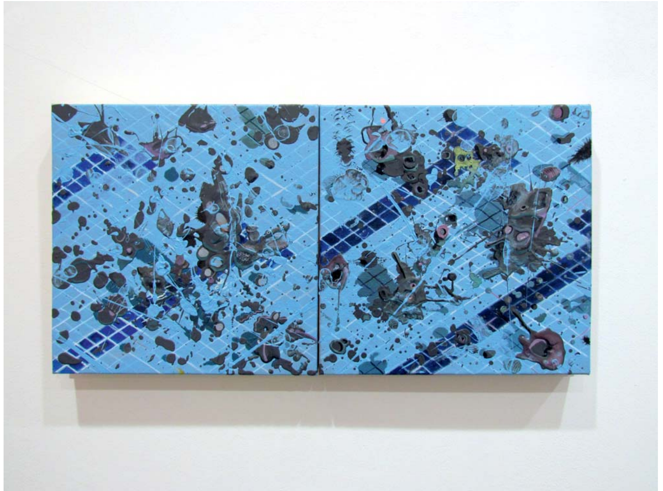
Jose Castiella | The end of the west, I & II, 2016 Acrílico y óleo sobre lino | 30 x 30 cm [x2]