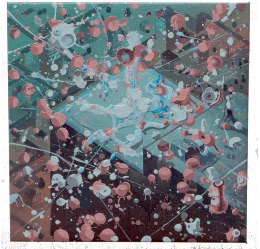
Jose Castiella | Watchers, 2016 Acrílico y óleo sobre lino | 30 x 30 cm