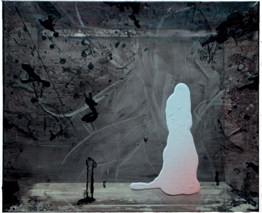
Jose Castiella | And the moon be still as bright, 2016 Acrílico y óleo sobre lino | 50 x 61 cm