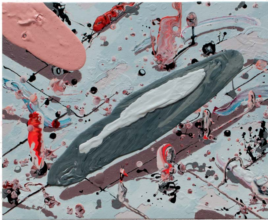
Jose Castiella | The long years, 2016 Acrílico y óleo sobre lino | 50 x 61 cm