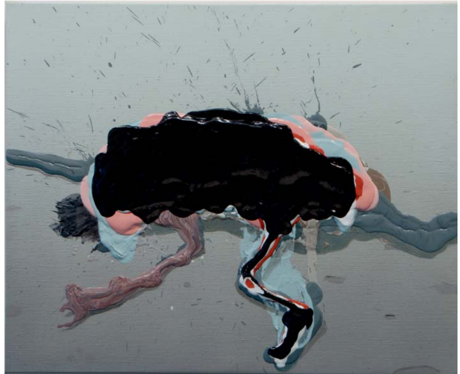
Jose Castiella | A settler, 2016 Acrílico y óleo sobre lino | 50 x 61 cm